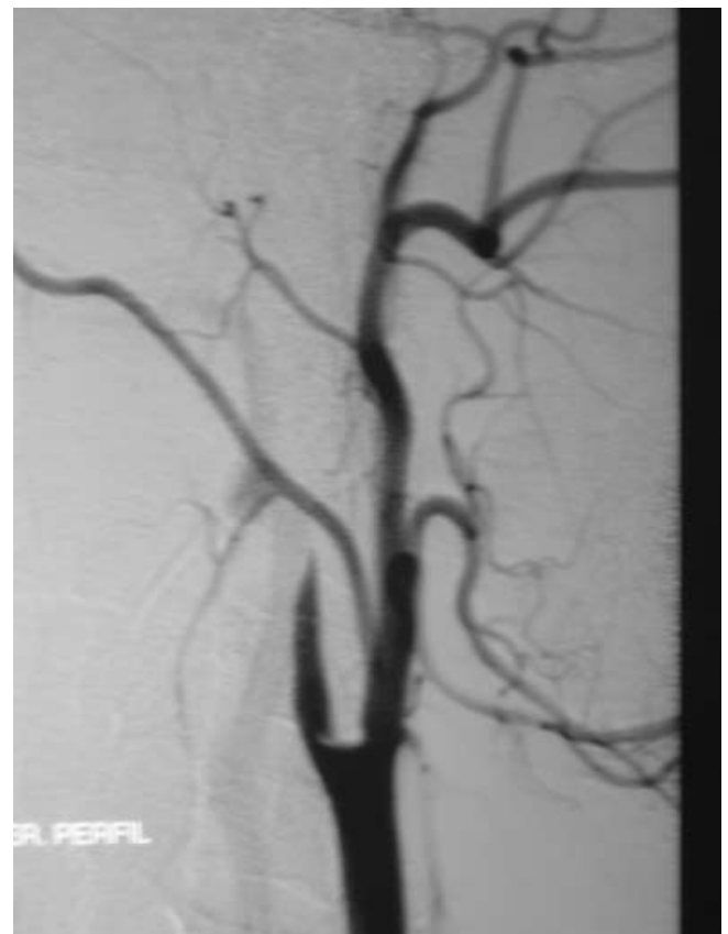
Fig. 3. Arteriografía de vasos de cuello. Permite visualizar imagen característica de disección arterial (flecha).