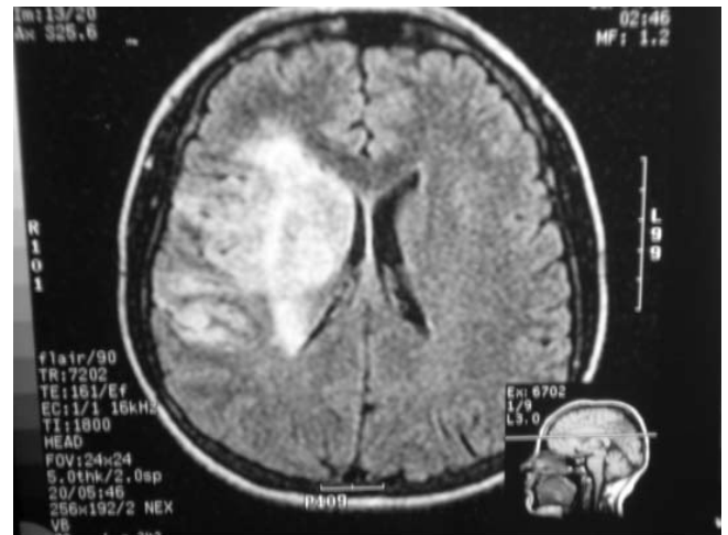
Fig. 2. Resonancia Nuclear Magnética. Permite valorar imagen compatible con Infarto de territorio superficial y profundo de Arteria Cerebral Media.