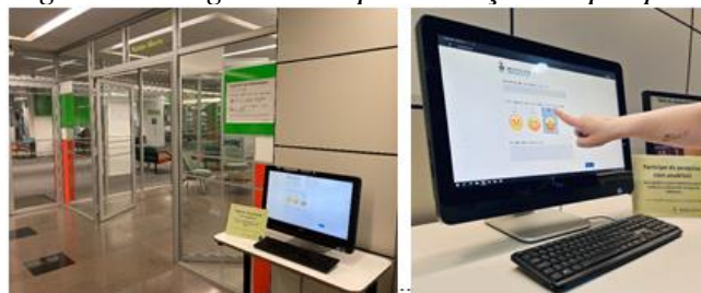
Figura 1: Imagens da implementação da pesquisa

Esta necessidade fez com que a pesquisa fosse desmembrada em diversos formulários on-line, gerenciados no sistema Qualtrics, formados por menos perguntas e correspondentes a cada recurso ou serviço avaliado. Estes foram disponibilizados permanentemente no ambiente físico da Biblioteca, por meio de computadores com tela touch, para os respondentes avaliarem determinado aspecto no momento da sua utilização (Figura 1). Assim, instituiu-se a Pesquisa Permanente de Usuários.