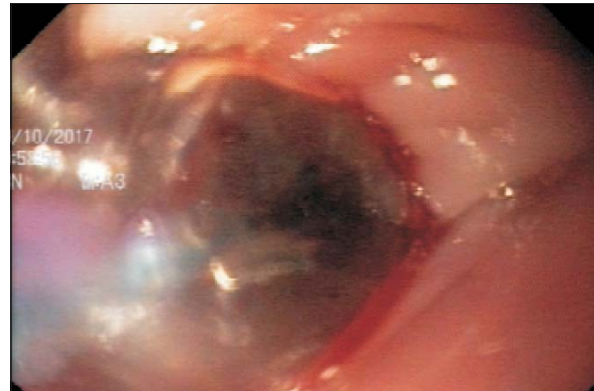
Figura 4. Primera sesión de dilatación con balón.