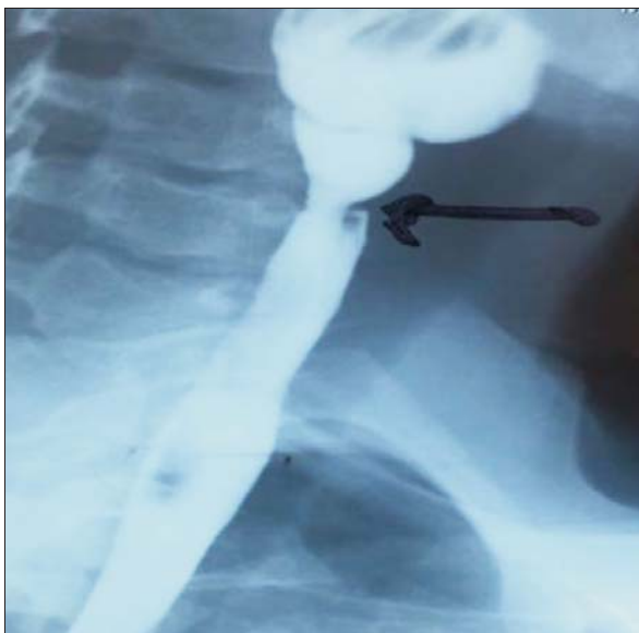
Figura 1. Membrana esofágica superior en esofagogastroduodeno con doble contraste.